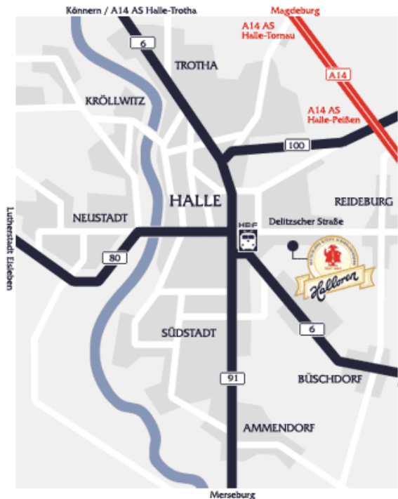
Halloren Schokoladenfabrik AG

Als Höhepunkt werfen Sie in einer 1½stündigen exklusiven Führung durch das Halloren Schokoladenmuseum und die Schauproduktion einen Blick hinter die Kulissen von Deutschlands ältester Schokoladenfabrik.